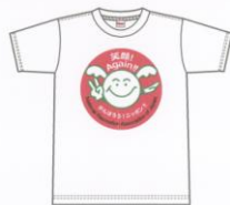
ホワイト-001 ジュニアサイズ: 110cm~150cmサイズ プリントサイズ: W20cm×H20cm