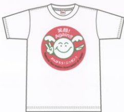
ホワイト-001 アダルトサイズ: S-XLサイズ プリントサイズ: W30cm×H30cm